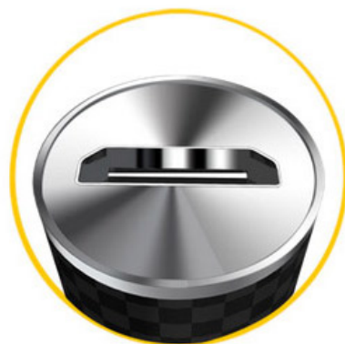
マイクロUSB充電ポート