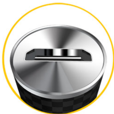
マイクロUSB充電ポート